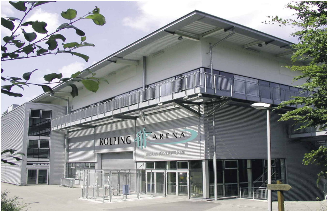
Sonderwerbform Stadion-Naming. Die Kolping Arena als neues Wahrzeichen der Kolping Krankenkasse.

Eine weitere Kommunikationsplattform stellt das Internet dar. Auf www.kolping-arena.ch wird ein breites Informationsspektrum über die Kolping Arena, Nutzungsmöglichkeiten für Private, verschiedene Services (z.B. kostenloser Newsletter, ein Link zum von Kolping gesponserten Hockeygame hockeymanager.ch ) und natürlich die Kloten Flyers geboten. Sogar ein Kolping-Arena-TV steht zur Verfügung, mit Spielen der Kloten Flyers aus der aktuellen National-League-Saison.