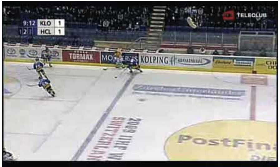
Bestandteil des Namensrechts Kolping Arena: Präsenz auf TV-Bande im Stadion.

Das Kolpingwerk wurde vom deutschen Theologen Adolph Kolping gegründet. 1813 bei Köln geboren und als Sohn eines Lohnschäfers aufgewachsen, lernte Kolping als Schumacher die Not der wandernden Handwerksgesellen kennen. Diese Erfahrung prägte seinen weiteren Lebensweg. Er besuchte das Gymnasium, studierte Theologie und wurde im Alter von 32 Jahren zum Priester geweiht. Nur vier Jahre später gründete Adolph Kolping in seiner Geburtsstadt den ersten Gesellenverein. Ziel war es, den wandernden Handwerksgesellen nebst Unterkunft in eigenen Hospizen die Möglichkeit zu geben, sich politisch,