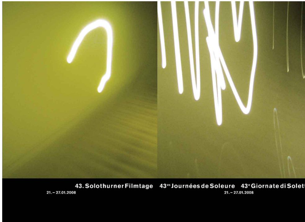
Markenauftritt Solothurner Filmtage: Das Vokabular wird durch Bilder ersetzt und zeigt das neue

Wo fehlen Ihnen noch Mittel und wie viel?