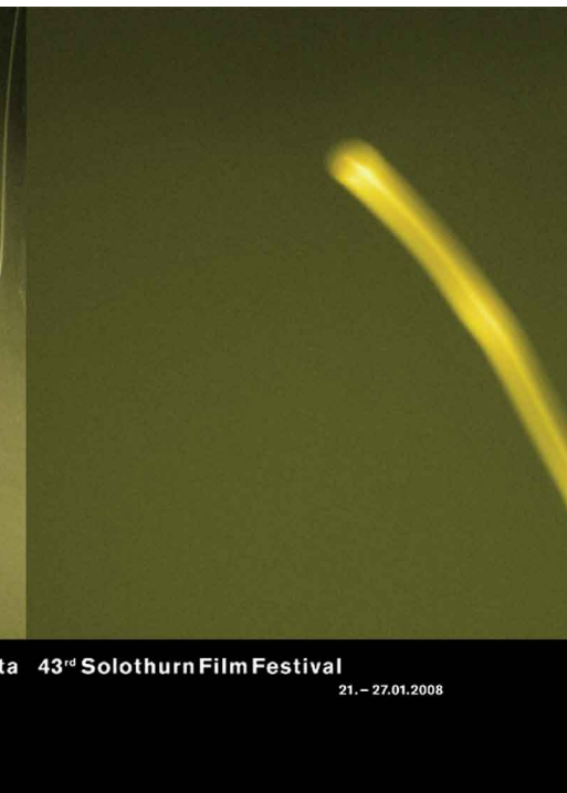
ta 43 rd Solothurn Film Festival 21. – 27.01.2008

Selbstverständnis des traditionellen Anlasses.